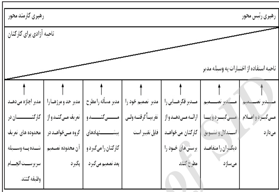
شکل ۱: الگو پیوستار رهبری «تنبوم و اشمیت» ۱ (۱۹۵۷)

۴. پیوستار دانشگاه‌های: هم‌زمان با مطالعات دانشگاه میشیگان، گروهی از پژوهشگران در دانشگاه‌های نیز در زمینه‌ی سبک‌های رهبری به مطالعه پرداختند. آنان پرسش‌نامه‌ای تهیه کردند که به کمک آن می‌توانستند رفتارهای رهبران مختلف را مورد سنجش قرار دهند و عواملی مانند عملکرد گروهی و رضایت خاطر را بررسی کنند تا مشخص شود چه سبکی تأثیرگذارتر است. بر اساس نتایج این تحقیق سبک‌های مختلفی تعیین شد، ولی دو سبک از اهمیت خاصی برخوردار بود: (۱) وظیفه یا هدف‌داری (ساخت‌دهی): شیوه‌ای است که رهبر نقش خود و نقش‌های کارکنان را بر حسب دستیابی به هدف‌های هر واحد تعریف می‌کند. این نقش‌ها شامل بسیاری از وظایف مدیریتی است؛ (۲) تشخیص نیازها و روابط افراد (مراعات) یا ملاحظه‌مداری: شیوه‌ای است که رهبر اعتماد طرفینی با کارکنان برقرار می‌کند. به نظرات آنان احترام می‌گذارد و به احساسات آنان علاقه نشان می‌دهد. چنین رهبری با دیگران دوستانه رفتار می‌کند. وی در ضمن برقراری ارتباط دوطرفه،